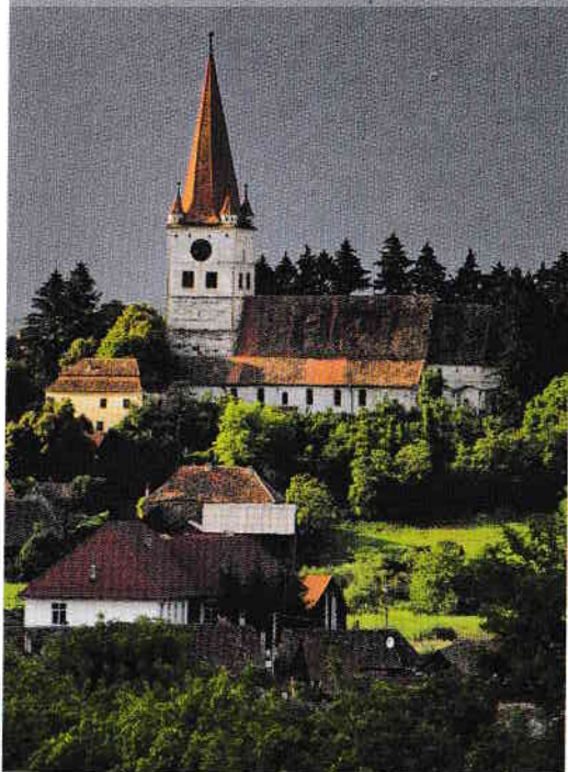
Biserica fortificată din Cincu / The fortified church of Cincu

Diversitatea etnică a Transilvaniei a fost materializată în elemente arhitecturale care formează peisaje culturale distincte. Aici coexistă burguri în stil occidental (Sighișoara, Sibiu și Brașov) cu așezări reprezentative pentru civilizația pastorală românească (Mărginimea Sibiului), pentru arta prelucrării lemnului (Țara Moșilor) sau pentru exploatarea minieră a aurului (Roșia Montană). Aici veți vedea, foarte aproape unele de altele, masive biserici-cetăți din piatră, investite cu rol militar (Biertan, Călnic, Dârjiu, Prejmer, Saschiz, Valea Viilor și Viscri) și biserici din lemn cu turlle zvelte (Țara Silvaniei). Aici este patria castelelor și a conacelor baroce (Ținutul Secuiesc), dar și a caselor din bârne, cu acoperișuri din paie, natural integrate în peisaj (Munții Apuseni). Transilvania