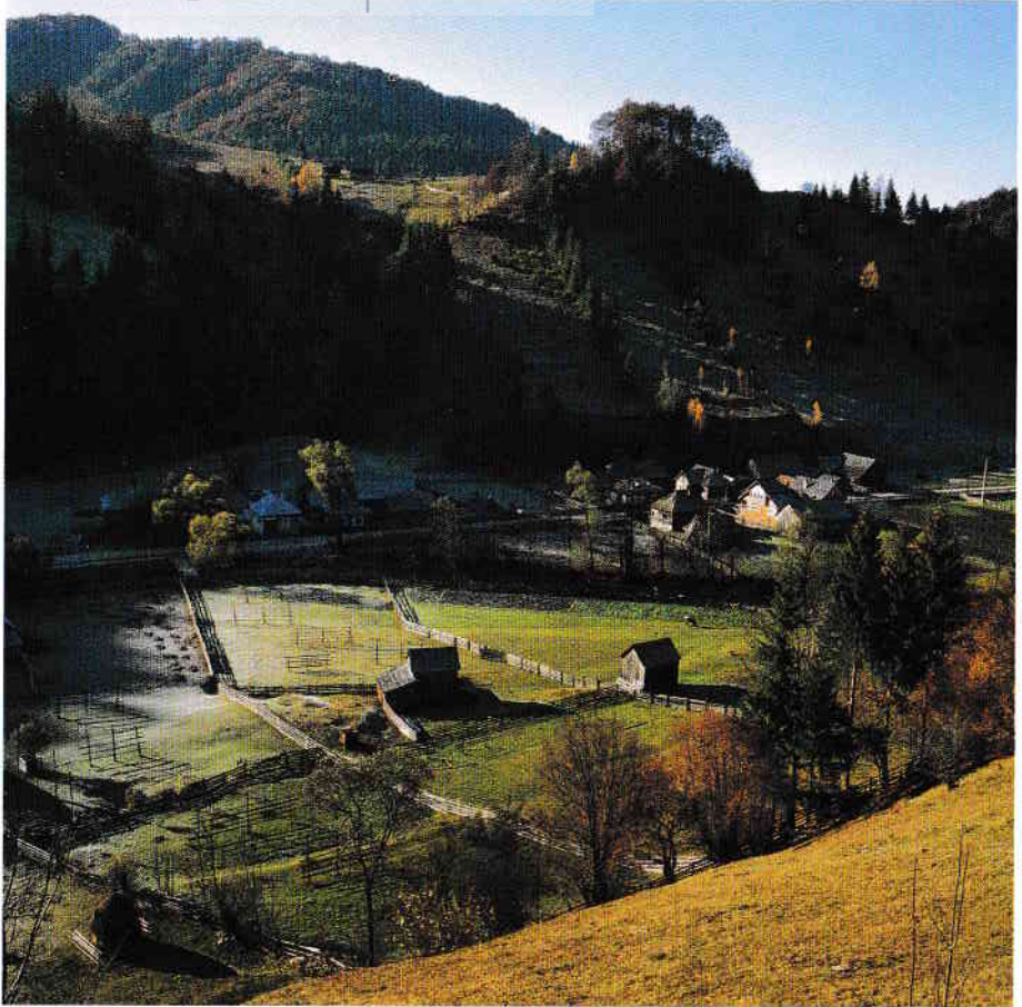
Prima brumă pe Valea Vinului, județul Bistrița-Năsăud Early hoarfrost, Vinul Valley, Bistrița-Năsăud County