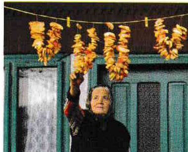
Căratul fânului, Vama Buzăului > Bringing in the hay, Vama Buzăului

Teritoriul actual al Transilvaniei a fost inițial parte a statului carpato-dunărean Dacia, iar după anul 106, parte a provinciei romane cu același nume și nucleu al formării poporului român și al limbii române. În ciuda presiunilor exercitate de popoarele migratoare, aici au apărut formațiuni statale precum cea a lui Gelou – Dux Blachorum (Ducele Vlahilor). După anul 1000, Regatul Ungar, o alianță de triburi stabilite la sfârșitul secolului al IX-lea în Câmpia Panonică, a început cucerirea „Țării de peste pădure” – Transilvania. Pentru consolidarea stăpânirii, regii maghiari au desfășurat un amplu proces de colonizare, încurajând stabilirea în zonă a sașilor – o populație mixtă germană și valonă – și a secuilor – un grup etnic de origine turcică, considerat astăzi parte a grupului etnic maghiar. Majoritatea conducătorilor români s-au retras la nivel local în țări ( terrae ), în special în zonele periferice ale Transilvaniei, în depresiuni și pe văile râurilor. Aceste „insule” au perpetuat specificul civilizației românești din cadrul Transilvaniei, care după ample acțiuni revendicative, în 1918, la sfârșitul Primului Război Mondial, se va uni cu România. În ansamblul noului stat, odată cu un teritoriu de circa 100 000 de kilometri pătrați a intrat o lume cu un tablou etnic și religios complex, cu un patrimoniu construit extraordinar și cu o zestre spirituală unică, rezultat al experienței multiseclare a conviețuirii.